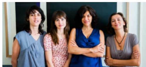
A direcção do DocLisboa

A próxima edição do festival DocLisboa, em Outubro, pretendo ser “um momento de celebração de cinema”, mas também um “lugar de reflexão” sobre o papel do documentário numa época de transformações sociais, defendeu esta terça-feira a nova direcção.