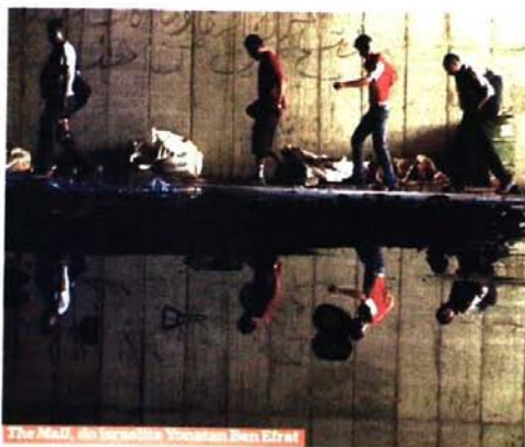
The Mall, de Yonatan Ben Efrat

Num "aposento" alguém colocou um poster da actriz Julianne Moore. No meio de rostos crispados e