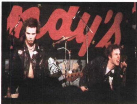
Sid Vicious e Johnny Rotten num concerto dos Sex Pistols em «D.O.A.», o filme mais famoso de Lech Kowalski. Em cima, à dir., foto do realizador e, ao lado, Johnny Thunders, guitarrista dos New York Dolls, em «Born to Lose»

No mês em que se comemoram os 30 anos do lançamento de Never Mind the Bollocks, Here's the Sex Pistols , mítico álbum de estúdio dos britânicos Sex Pistols e um dos símbolos máximos do punk (ver pág. 10), o Doc exhibe em Lisboa uma retrospectiva com os filmes mais importantes de Lech Kowalski. Acaso ou não, a verdade é que Kowalski está intimamente ligado ao punk e aos Pistols. Um dos seus primeiros filmes, e ainda hoje o mais famoso, D.O.A. — A Right of Passage (também conhecido por Dead on Arrival ), acompanharia a catastrófica «tournee» americana do grupo de Johnny Rotten e Sid Vicious, a mesma que acabaria por ditar o fim da banda. D.O.A. consegue absorver o ambiente que fervilhava em torno do movimento e as reacções das pessoas àquela «revolução em cur-